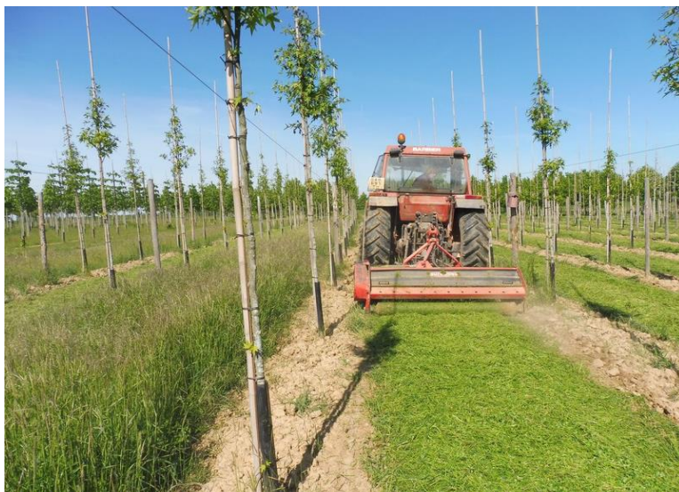
Broyage tardif des bandes enherbées, tout en préservant des parcelles libres non broyées, pour la biodiversité.