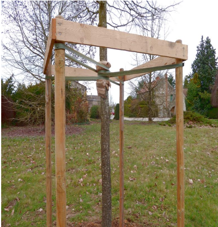
Tuteurage en quadripode

« Abeilles en mai valent un louis d'or, abeilles en juin, c'est chance encore. »